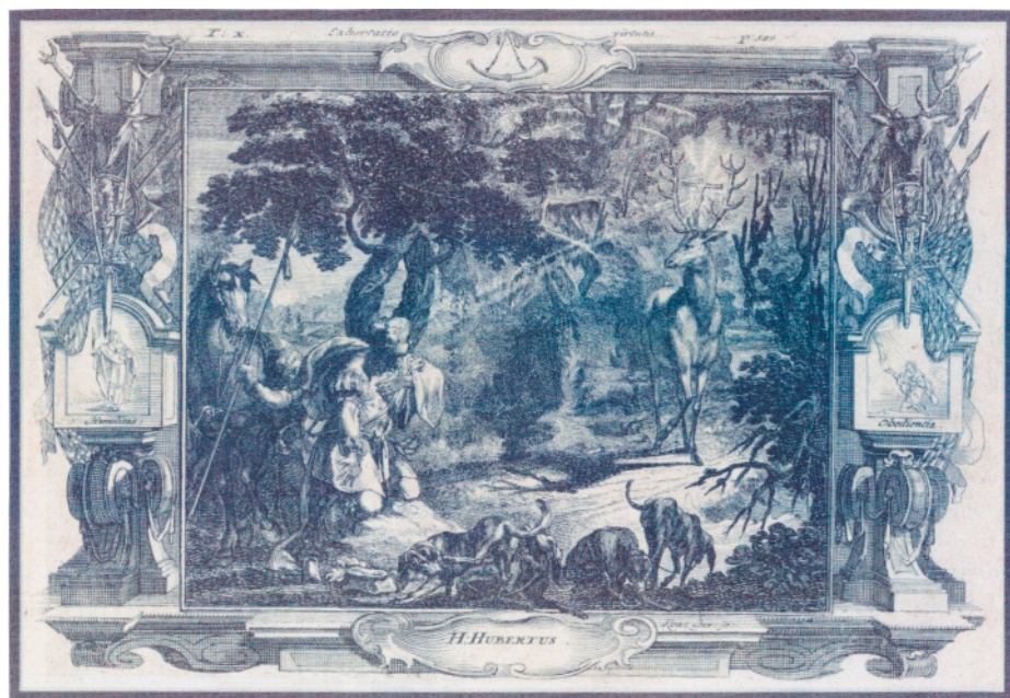
Vidění svatého Huberta /Svatohubertská legenda/ - KŘESŤANSKÝ ROK 1727 (III/262)