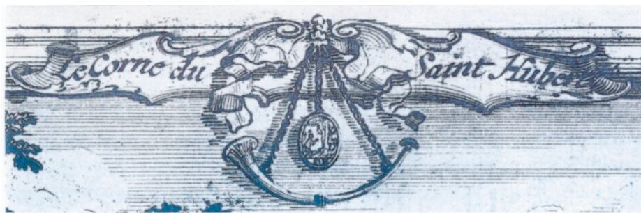
„LE CORNE DU SAINT HUBERT“ – DETAIL S ODZNAKEM LOVECKÉHO BRATRSTVA SV. HUBERTA

lovecký oštěp. Psi pokorně a klidně leží u nohou Hubertových. Nad výjevem v lunetě je lovecký roh, bez dalších atributů, které by upozorňovaly k loveckému bratrstvu. Proč také, když jde čistě o legendu bez vztahů k Řádu. Ale ztvárnění je velmi blízké „svatohubertské horničce“. V levé části na podstavci je vyobrazena žena s latinským názvem HUMILITAS. Je to jedna z cností s názvem POKORA. Vpravo na totožném podstavci je jiná žena s názvem OBSEDIENTIA. Je to jiná cnota s názvem ÚCTA. Nad nimi jsou zobrazeny